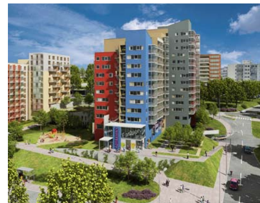
OBYTNÝ SOUBOR BOHDALEC, 2. ETAPA GEOSAN DEVELOPMENT a. s.

www.geosan-development.cz www.byty-bohdalec.cz