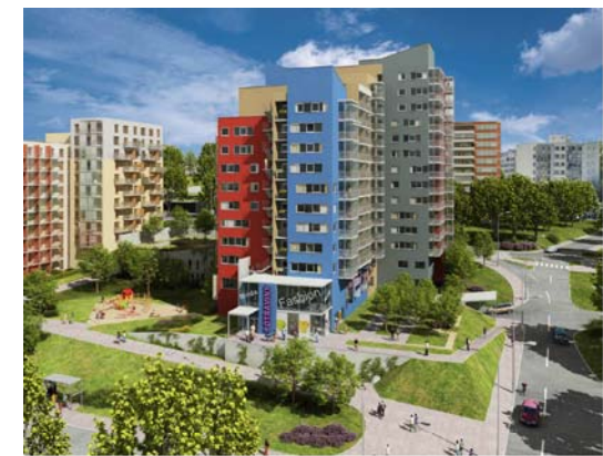
OBYTNÝ SOUBOR BOHDALEC, 2. ETAPA GEOSAN DEVELOPMENT a. s.

www.geosan-development.cz www.byty-bohdalec.cz