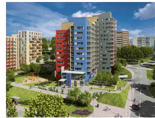
OBYTNÝ SOUBOR BOHDALEC, 2. ETAPA GEOSAN DEVELOPMENT a. s.

www.geosan-development.cz www.byty-bohdalec.cz