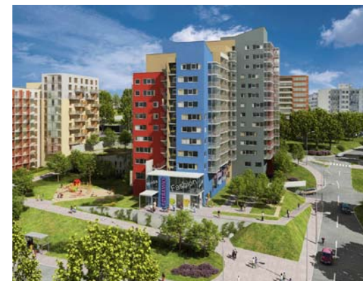
OBYTNÝ SOUBOR BOHDALEC, 2. ETAPA GEOSAN DEVELOPMENT a. s.

www.geosan-development.cz www.byty-bohdalec.cz