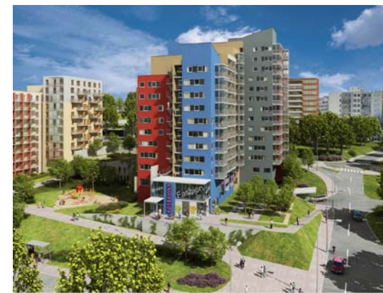
OBYTNÝ SOUBOR BOHDALEC, 2. ETAPA GEOSAN DEVELOPMENT a. s.

www.geosan-development.cz www.byty-bohdalec.cz