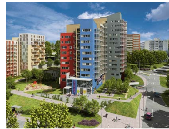
OBYTNÝ SOUBOR BOHDALEC, 2. ETAPA GEOSAN DEVELOPMENT a. s.

www.geosan-development.cz www.byty-bohdalec.cz