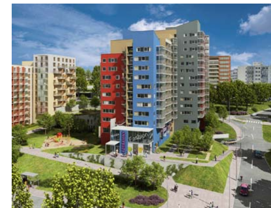
OBYTNÝ SOUBOR BOHDALEC 2. ETAPA GEOSAN DEVELOPMENT a. s.