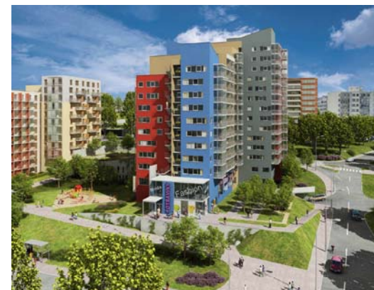
OBYTNÝ SOUBOR BOHDALEC 2. ETAPA GEOSAN DEVELOPMENT a. s.

www.geosan-development.cz www.byty-bohdalec.cz