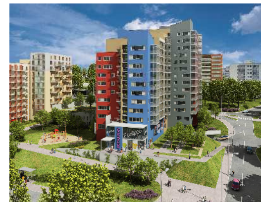
OBYTNÝ SOUBOR BOHDALEC, 2. ETAPA GEOSAN DEVELOPMENT a. s.

www.geosan-development.cz www.byty-bohdalec.cz