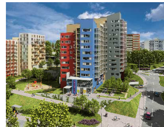
OBYTNÝ SOUBOR BOHDALEC, 2. ETAPA GEOSAN DEVELOPMENT a. s.

www.geosan-development.cz www.byty-bohdalec.cz