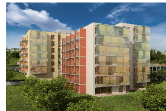
OBYTNÝ SOUBOR BOHDALEC