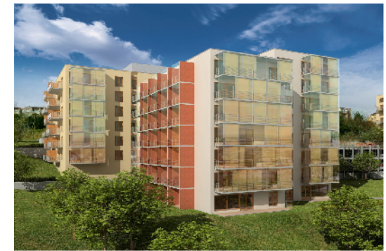
OBYTNÝ SOUBOR BOHDALEC