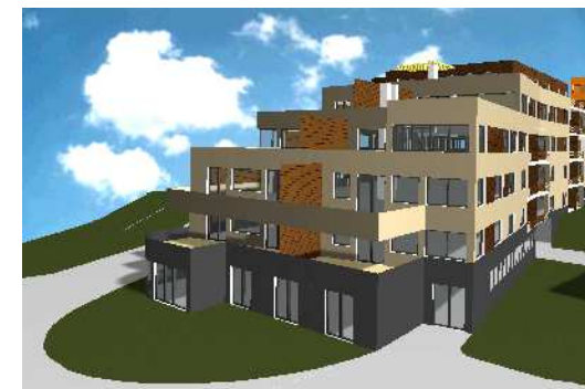
KASKÁDY U BOTIČE